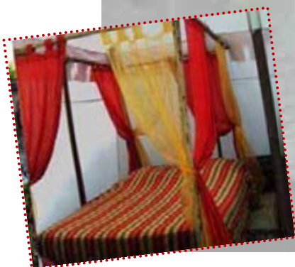
Nuit en tente médiévale à Vitré http://pagesperso-orange.fr/nuitmedievale/