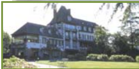
ArMilin' à Châteaubourg http://www.armilin.com/