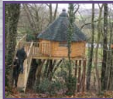
Cabane dans les arbres à Janzé