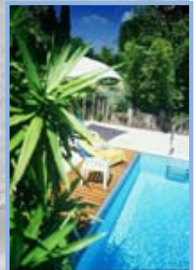
Hotel-restaurant Pen'Roc à Châteaubourg - http://www.penroc.fr/