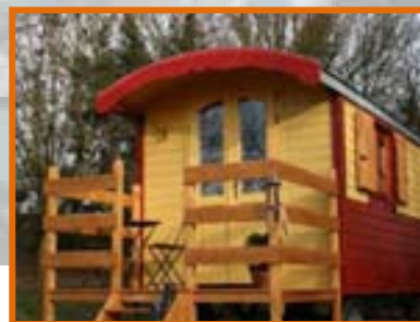
Nuit en roulotte à Lailé - http://www.lenclosdelola.com/